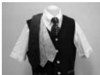
Krawatten und dazu passendes Gilet in 20 verschiedenen Dessin erhältlich.