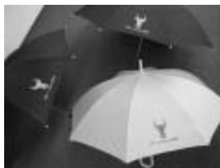
Schirme „Uri immer schön“ in schwarz, gelb und rot.