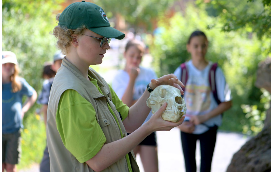
Der Tierparkbesuch lässt sich für Schulklassen mit einer spannenden Führung ergänzen.