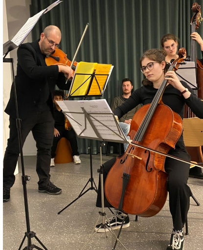
Das Laufbahn Café wurde musikalisch umrahmt

Ein besonderes Highlight der Woche war das Laufbahn-Café zum Thema «Umbruch im (Berufs-)Leben» in der Kantonsbibliothek Uri. Hier ging es ums Erzählen, Zuhören und den persönlichen Austausch. In einer offenen, wertschätzenden Atmosphäre berichteten Menschen aus Uri von ihren beruflichen Wegen, von Höhenflügen, Enttäuschungen, vom Dranbleiben und vom Neuanfang. Es war beeindruckend zu hören, wie viele Menschen mutig und neugierig ihre nächsten Schritte angehen und einige Unterstützung in einer Laufbahnberatung fanden. Genau solche Momente zeigen, wie wertvoll der Austausch und eine Laufbahnberatung für individuelle Wege sein können.