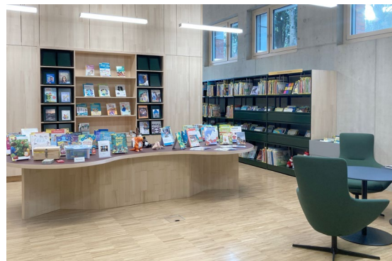
Die neu eröffnete Bibliothek der PH Schwyz in Pfäffikon

Die Orientierung am Vier-Räume-Modell unterstützt diese Entwicklung. Die Bibliothek wird damit nicht nur als Infrastruktur, sondern als aktiver Bildungsraum verstanden, in dem Lernen, Austausch, Inspiration und Mitgestaltung zusammenwirken. Studierende, Lehrpersonen und Weiterbildungsteilnehmende finden hier vielfältige Möglichkeiten, sich Wissen anzueignen, miteinander in Austausch zu treten und neue Perspektiven zu entwickeln. Das Vier-Räume-Modell bietet der PH Schwyz eine tragfähige Grundlage, um die Bibliothek langfristig als Lern-, Arbeits- und Begegnungsraum weiterzuentwickeln und ihre Rolle innerhalb der Lehrerinnen- und Lehrerbildung zu stärken.